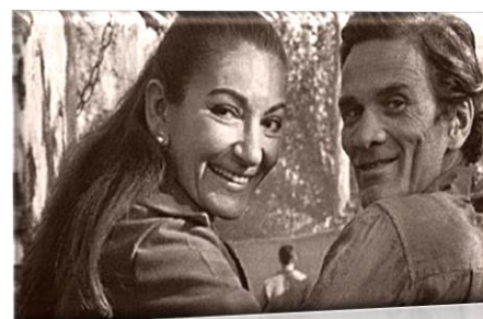
Maria Callas e Pier Paolo Pasolini

Noi ti consigliamo l'ascolto di Callas at la Scala (1956).