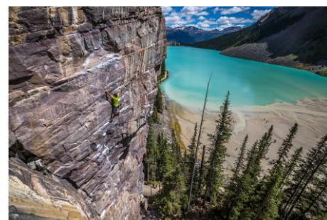
Marc-André Leclerc in scalata libera

Ad oggi non si trova alcun libro, neanche in lingua inglese, che ci consenta di conoscere meglio la vita di Marc-André Leclerc . Nel 2021 è uscito però un docu-film intitolato The Alpinist , per una parte seguito in fase di ripresa dallo stesso Leclerc. Poi, schivo alla notorietà, decise di abbandonarne il set per tornare a inseguire le sue amate montagne.