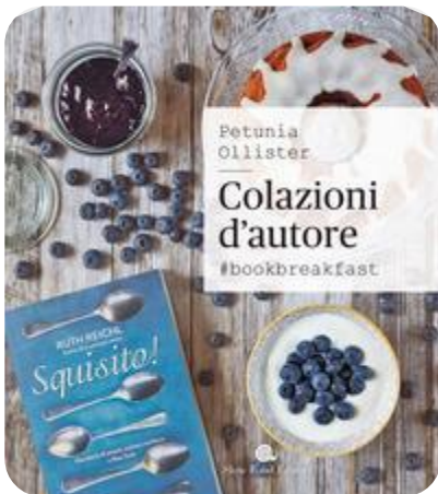
La copertina del volume

#bookbreakfast è un libro illustrato che raccoglie un centinaio di belle immagini di Petunia Ollister realizzate appositamente per il progetto.