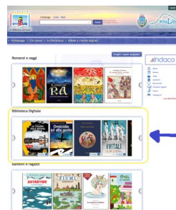
L'home page della Biblioteca digitale

In Biblioteca digitale, come indicato dall'immagine, ci sono i materiali che possono essere presi in prestito, dagli utenti registrati, direttamente sui loro device (smartphone, computer, e-reader, ecc.).