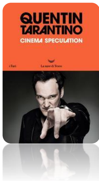
La copertina del volume

...è la storia di un bambino innamorato del cinema che passa le serate con i genitori nelle sale di Los Angeles .