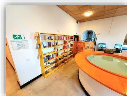
Il nuovo spazio espositivo per le ultime Novità e le Promozioni della lettura

Gli utenti troveranno così un nuovo spazio, comodo e di impatto, per una ricerca più agevole tra quei volumi che mettiamo in evidenza per le loro caratteristiche (appena acquistati o facenti parte di Promozioni della lettura).